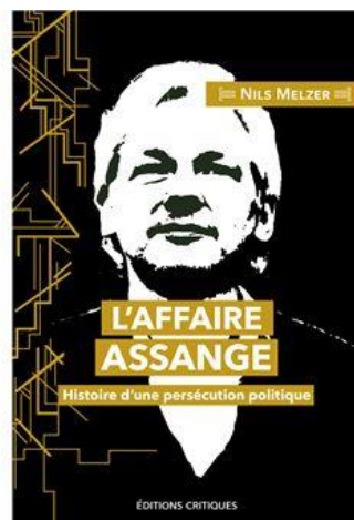
法语版“阿桑奇事件”