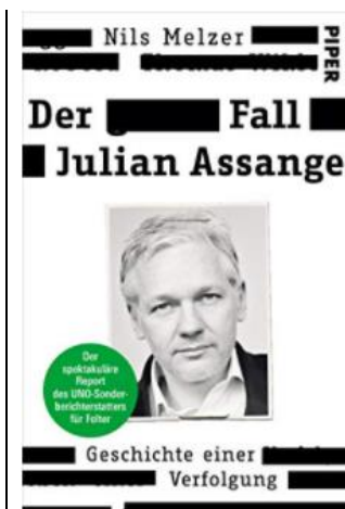
德语版“阿桑奇事件”